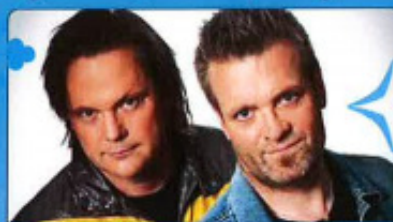
EKMAN FRÅN FREESTYLE & SYD FRÅN GYLLENE TIDER