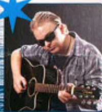
LED ZIXY MED ALEXANDER