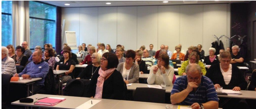
Bild från fortbildningen 2014