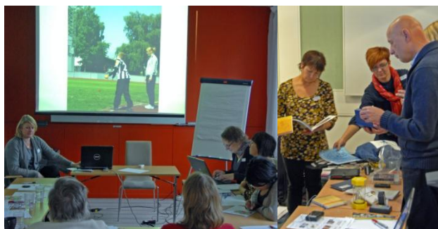
Bilder från en FUB-konferens