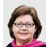
Kia Mundebo Konferensvärd FUB