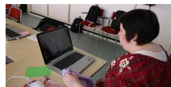
Bild från FUB:s projekt Anpassad IT , som gjorde en kurs på Mora folkhögskola.

Funktionsrätt-folkhögskolor – gå in på www.skrivunder.com/funktionsratt-folkhogskolor och läs mer och skriv på!