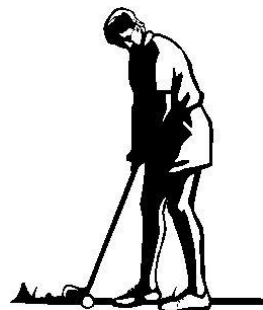
Bli en golfare

Birger och Signe Skogsborgs stiftelse verkar för en bättre livssituation och utvecklande upplevelser, både individuellt och i grupp, för barn och ungdomar med funktionsnedsättning på Lidingö.