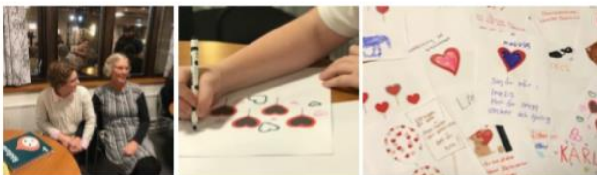
Bilder från "Tillsammansfest" den 30 oktober 2019

En brukarträff med böcker, högläsning, dans och sång.