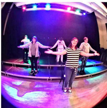
...nu kör vi ...

Läs gärna mer på Facebook samt hemsidan vitasvanen.com !