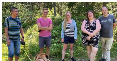
VI SOM ARBETAR I PROJEKTET

Vi vill göra det lättare för personer med intellektuell funktionsnedsättning eller autism att ha bra relationer.