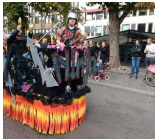
Från karnervalen i Karlstad

Aktuell: Genom sin medverkan i Lerins lärlingars resa till Brasilien