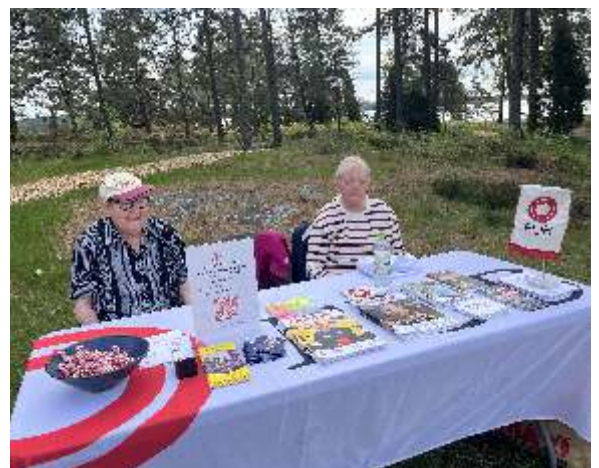
Text: Sofie Persson

Maria passade på att serva sin rullator när hjälpmedelsservice fanns på plats.