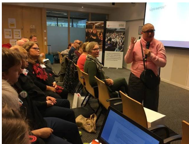
Inspirationsdagar med Inre Ringen Stockholm