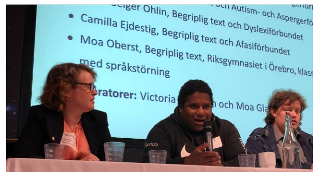
Projekt Begriplig text