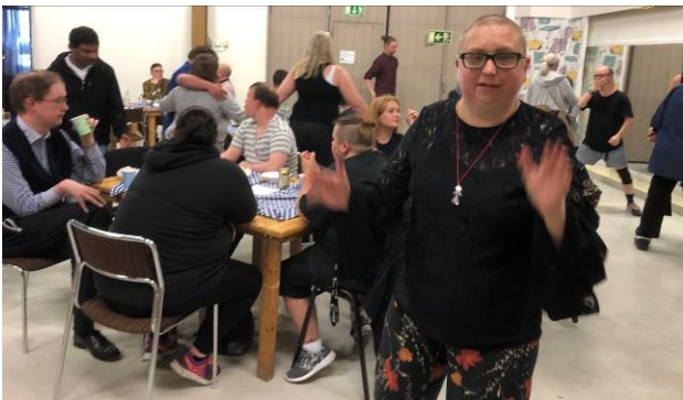
After Work 30 års kalas