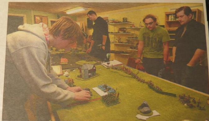
Killigt? Roll- och figurspel är just nu en väldigt manlig historia i Hallstahammar.

– Vi har anlitat en konsult som kommer att jobba med frågan, men exakt hur det ska